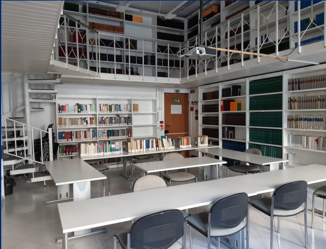
Biblioteca di Scuola di Scienze Sociali - Sede di Giurisprudenza "P.E.Bensa". Università di Genova Via Balbi 130r | 16126 Genova Tel: 010 2099883 email: bibliogiurisprudenza@unige.it